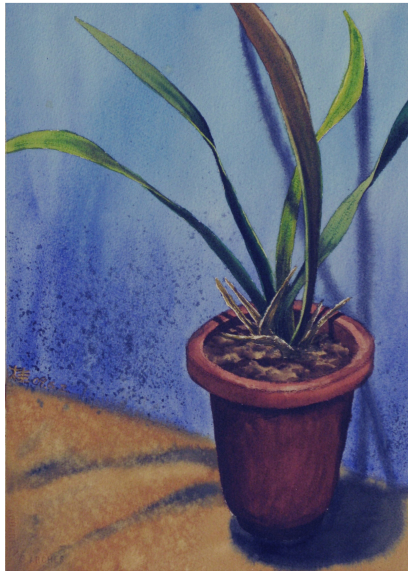
畫作：十分小鎮的盆景